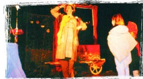
Des enfants viennent faire avancer l'histoire à la brouette -théâtre.

- une comédienne conteuse et marionnettiste à laquelle peut s'adjoindre un musicien et un marionnettiste , selon les salles et le cadre de la manifestation.