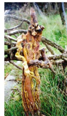
Racine, le Seigneur des bois..